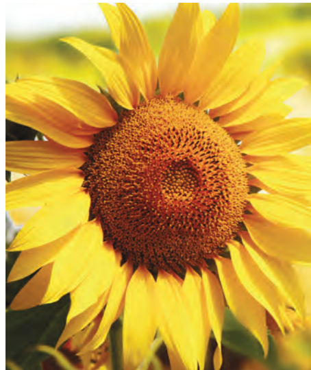
Zincirin bir diğer önemli halkası ise Volgograd'da yer alan 200 milyon dolarlık ayçiçeği kırma tesisi. Bu aynı zamanda Cargill'in yedi yıldır üzerinde çalıştığı bir projedir. Tesis 2015 yılında faaliyete geçtiğinde Cargill, Rusya'nın en büyük yağlı tohum kırma fabrikalarından birine sahip olacak.

Azrak Denizi'ne daha sonra da Karadeniz'e dökülür. Nehir limanları, 3-5 bin tonluk yükün yüklenildiği küçük gemilere hizmet veren küçük limanlardır. Rostov bölgesinde yer alan Don terminali, bir sezonda 500.000 ton tahıl yükleyebiliyor.